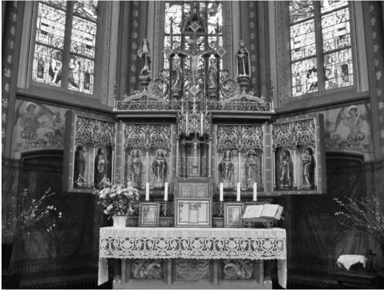
Altaar in St. Willibrorduskerk

een kop koffie konden de 30 aanwezigen rondkijken en vragen stellen over het werk van de Ludgerkring en er kon informatie worden ingewonnen over deelname aan de tocht naar Werden-Essen (zie elders in deze Periodiek).