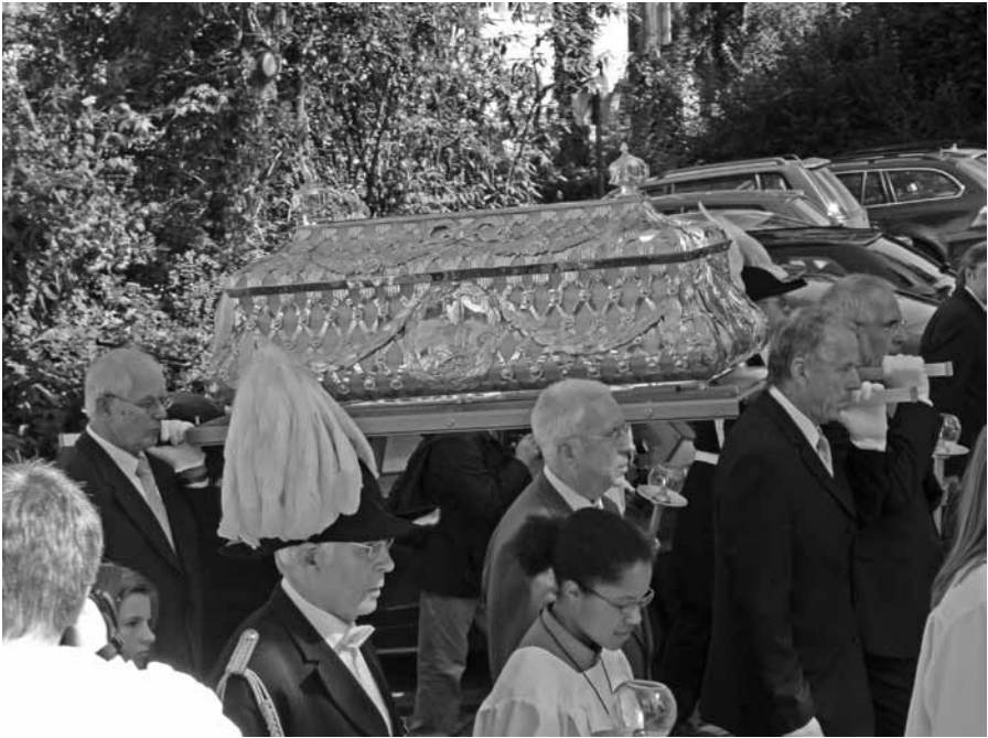
Met de Ludgerschrijn op de schouders