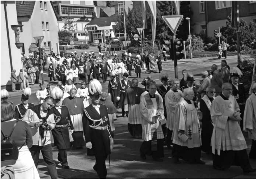
De Ludgerprocessie trekt door de straten van Werden

In Nederland herleeft de belangstelling voor Ludger. Na de golf van parochiefusies blijken twee nieuwe parochies naar hem vernoemd, te weten in Utrecht stad en in de Achterhoek rond Aalten. Na Willibrord en Bonifatius geboren, niet zoals zij in Engeland maar in Nederland, en na hun dood aan het werk gegaan, staat Ludger als voltooiër van hun arbeid naast deze twee. Dat wordt meer en meer beseft. Hij is mede-grondlegger van de christelijke cultuur van Nederland en het aangrenzende deel van Duitsland. In Werden maar ook in Münster, waar hij in 805 de eerste bisschop werd, en Billerbeck, waar hij in 809 stierf, wordt de Nederlandse Ludger geëerd en geprezen. In 2005, 1200 jaar na zijn bisschopswijding, vond de grote Ludgerestafette van Utrecht naar Münster plaats. Ze heeft de belangstelling voor Ludger in ons aartsbisdom aangewakkerd. De aanstaande translatio van de Ludgerrelik wordt een nieuw hoogtepunt.